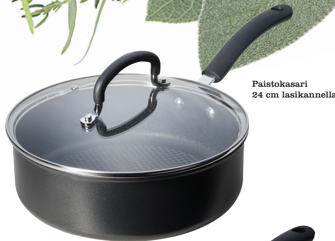
Paistokasari 24 cm lasikannella