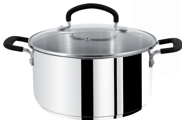
Kattila 2,9 l / 20 cm

Kattila ja keittokasari ruostumatonta terästä