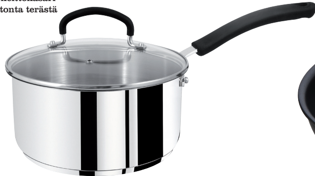
Keittokasari 1,5 l / 16 cm

Kattila ja keittokasari ruostumatonta terästä