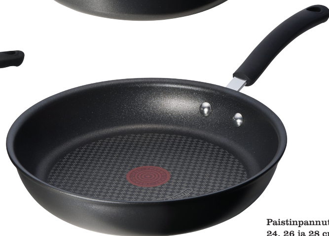
Paistinpannut 24, 26 ja 28 cm